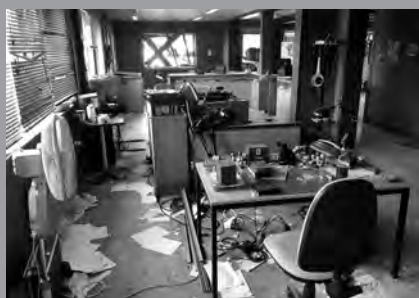
Dreharbeiten, „Angriff auf Wache 08“

Das Szenenbild ist die visuelle Welt eines Films. Doch wie wird diese vom Szenenbildner und seinem Team gestaltet? Mit dem Lesen des Drehbuchs und Gesprächen mit der Regie beginnt die Ideenfindung. Ein Eckpfeiler und wichtige Basis des Szenenbildes sind die Drehorte, die der/die Locationscout*in sucht. Hierbei sind neben visueller und inhaltlicher Qualität auch Logistik und Funktionalität wichtig. In der weiteren Gestaltung des Szenenbildes folgen Skizzen, Moodboards und Entwürfe. Wichtig sind auch die Budgetplanung, Kalkulation, Personal und Bauplanung. Am Ende stehen die fertig gestalteten und eingerichteten Drehorte mit allen Details wie Bauten, Wandfarben, Möbeln, Tapeten, Vorhängen, Bildern, Deko und Requisiten – und das drehplangerecht zum richtigen Zeitpunkt.