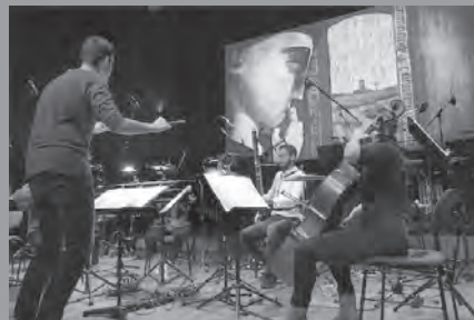
Musik für Stummfilme (2018)

Filmmusik und das mit ihr verbundene Filmrechte-Clearing zählt nach wie vor zu den entscheidenden Faktoren für den Erfolg eines Filmes.